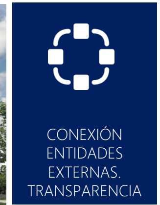
Sede Futuver España, Gijón (Asturias)